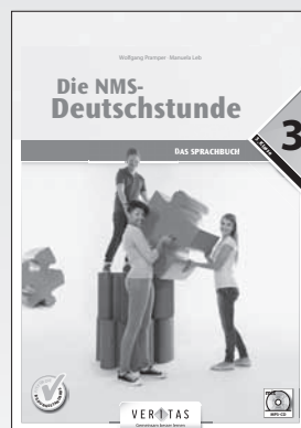
Die NMS-Deutschstunde 3. Das Sprachbuch (inkl. mp3-CD für Hörbeispiele) SBNR 165.156 SBNR 165.164 (Buch mit CD-ROM)

Daneben gibt es auch weiterhin die kombinierte Ausgabe: