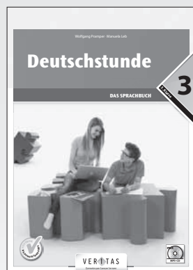
Deutschstunde 3. Das Sprachbuch (inkl. mp3-CD für Hörbeispiele) SBNR 165.092 SBNR 165.153 (Buch mit CD-ROM)

Deutschstunde 3. Das Lesebuch ist in Kapitelgliederung und Themenwahl auf beide Ausgaben des Sprachbuchs abgestimmt, kann aber natürlich auch als unabhängiges Lesebuch verwendet werden: